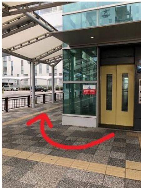
④ エレベーターを降りたら反対方向へ回る。