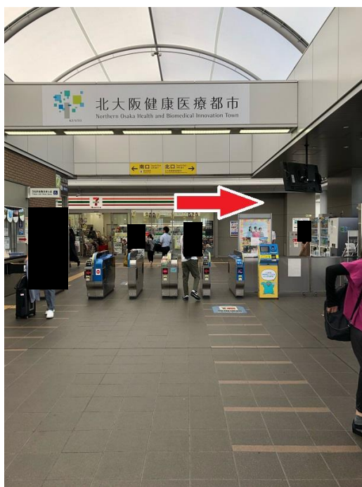
① JR 岸辺駅改札口を出て右へ。