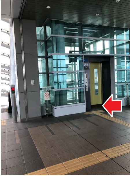
③ 左側に見えるエレベーターで1階へ降りる。