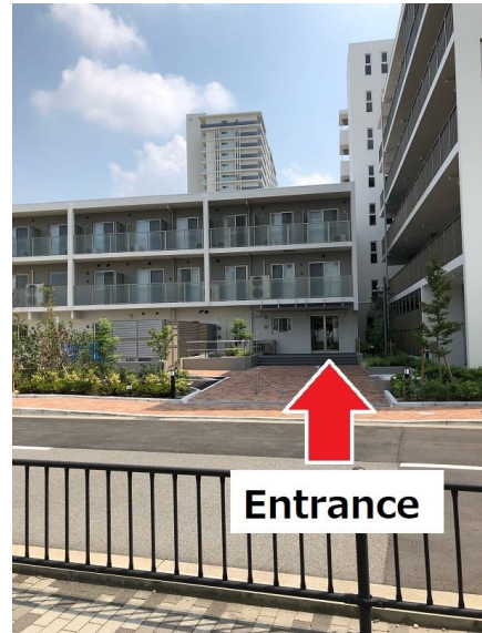
エントランスを入ってすぐ左側が管理員室です。