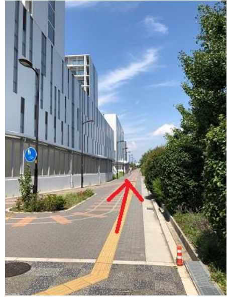
⑤ 国循のファサードに沿って、京都方向へ進む。