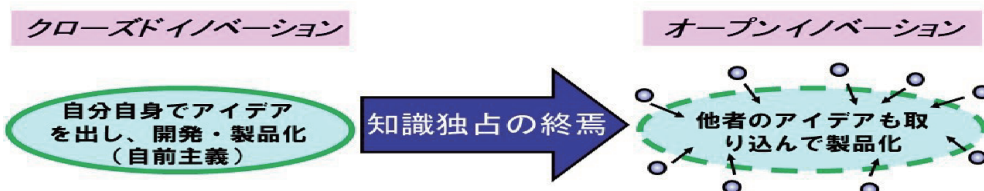
(図1) イノベーションの進化

オープンイノベーションモデルでは、外部資源の活用によるコスト削減と開発の時間短縮を実現するとともに、未利用の特許などの内部資源を外部で活用することによる増収が期待されることから21世紀型のビジネスモデルとして関心が高くなっています。