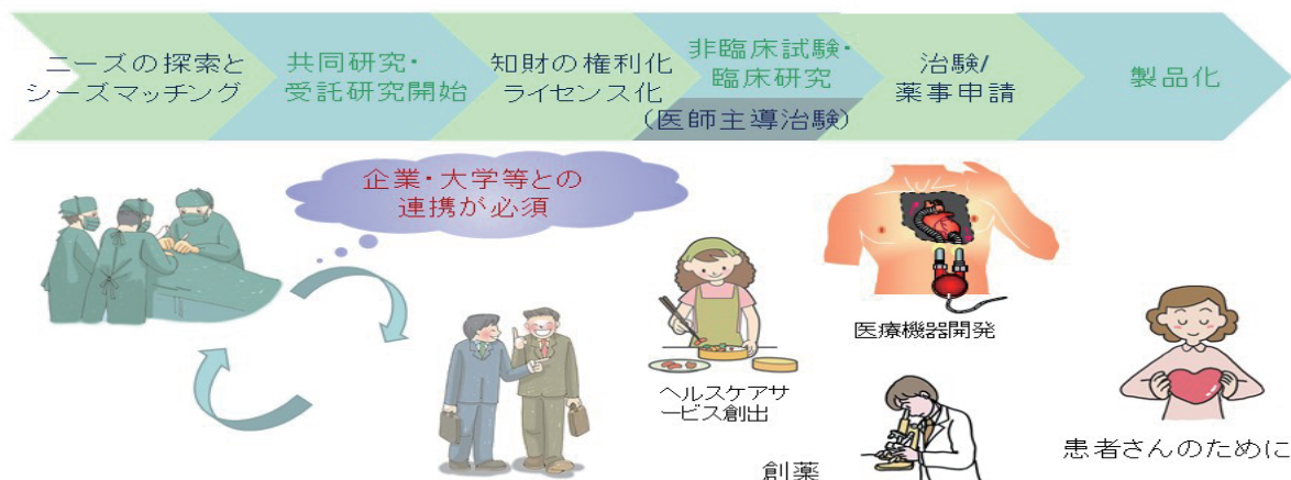
(図5) 産学連携本部の活動

革新的な医療機器・医薬品・ヘルスケア技術の製品化・事業化には、1) 臨床での潜在的ニーズの探索と解決へとつながる見込みのある技術シーズとのマッチングから、2) 共同研究・受託研究の進展へとつながり、そこから得られる研究成果として3) 知的財産の権利化・ライセンス化などを伴いつつ、4) 非臨床試験・臨床試験などによる検証を踏まえて、5) 治験・薬事申請へと進めるようなプロセスを辿ることが多々あります(図5)。このようなプロセスでは企業・大学などとの連携が必須であり、産学連携本部では臨床現場から得られた課題解決策や研究活動から得られた成果を知的財産として適正に保護するとともに、新しい医療・ヘルスケアとして社会に適切に還元されるよう事業化を促し、循環器病の究明と制圧に資する活動を進めています。同本部は知財戦略室と事業化推進室から構成されており、常勤・非常勤を含め現在 10 名強のスタッフで運用されています。臨床現場から導かれる課題解決策や研究活動から得られた成果を知的財産として適正に保護するとともに、新しい医療・ヘルスケアとして社会に適切に還元されるよう事業化を促し、循環器病の究明と制圧に資する産学連携を進めます。