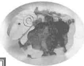
手作り体験 (各自自由に～) ウール工房 まきまき羊など