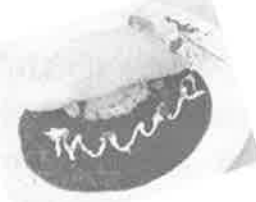
小岩井農場たまごのオムライスセット (同一メニューです)